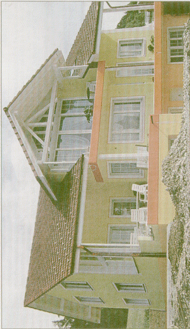
Das individuelle Traumhaus, das vom Architekten geplant wurde, muß nicht teurer als ein Haus von der Stange sein

Der Architekt setzt die individuellen Wünsche des Bauherrn um