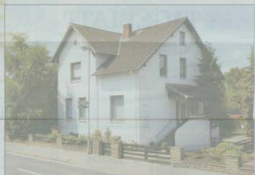
Das Büro in der Estebürger Straße 7 in Buxtehude.