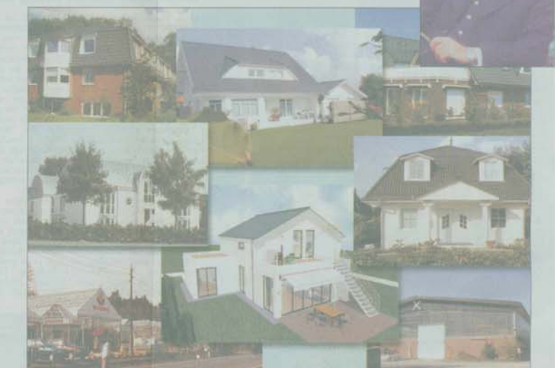
Ein Überblick über das Leistungsspektrum des Buxtehuder Architekturbüros: Vom Einfamilienhaus über Industrie- und Gewerbebauten bis zum Hallenbau.

Zur Philosophie ihrer Arbeit, gehört an allererster Stelle die zuverlässige und individuelle Betreuung des Bauherrn. So unterstützen sie auch Eigenleistungen mit kompetenter Beratung, Festgefahrene Mechanismen sind ihnen fremd, ebenso Schubladenpläne, ihre Lösungen werden maßgeschneidert und individuell erarbeitet! Das fundierte Fachwissen wird regelmäßig auf den neuesten Stand gebracht. Weiterbildung sowie die Teilnahme an Fachseminaren oder Workshops ist ein „Muss“.